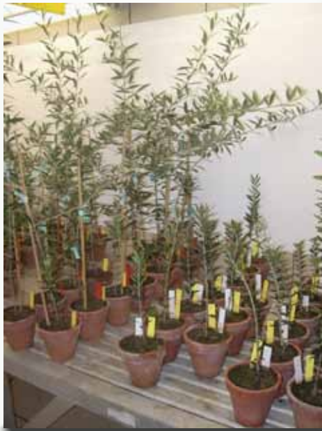
Olivos, cv. Picual, tratados y sin tratar.