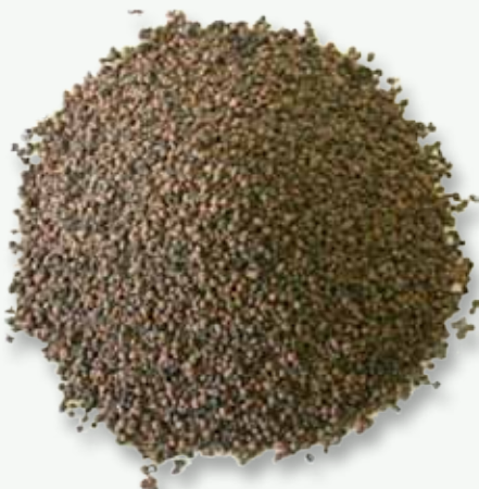
Producto MYCOSYM TRI-TON®

Con su enfoque profesional MYCOSYM tiene el propósito de establecer nuevos estándares en el cultivo de plantas.